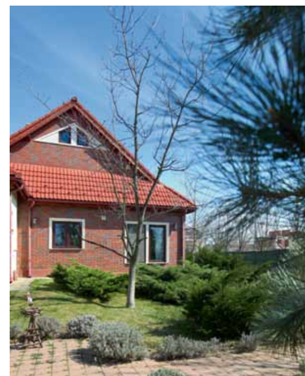
▲ CÂTEVA ALEI CU DALE străbat întinderea imensă de gazon, într-un loc în care suprafețele betonate lipsesc cu desăvârșire.

Faptul că trăiești înconjurat de natură, într-o comunitate de oameni care ți-au devenit prieteni, precum și frumusețea în sine a casei constituie marile atuuri ale acestei proprietăți.