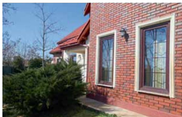
▲ CORPURILE DE ILUMINAT PENTRU EXTERIOR, în formă de felinare, întregesc aspectul pitoresc al fațadelor.

natural împotriva zgomotului și noxelor. În plus, după anul 2000, zona a devenit exclusivistă, fiind căutată de oameni cu un anumit nivel de trai, care au dorit să fie mai aproape de natură, păstrându-și totodată standardele de viață. „Rar întâlnești un loc atât de liniștit și de natural, care să fie în același timp aproape de tot ceea ce ai nevoie. DN 1, aflat în josul străzii, face legătura între aeroport, centrele comerciale și centrul orașului.”